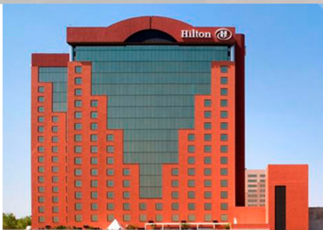
Sede del CIEM 2014:

Para registrarse en un taller deberá cubrir antes el costo del carnet.